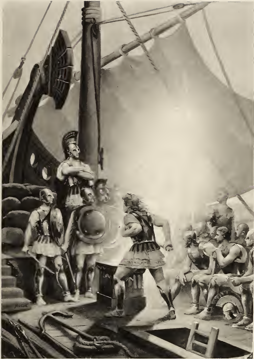
H. MOTTE INV.